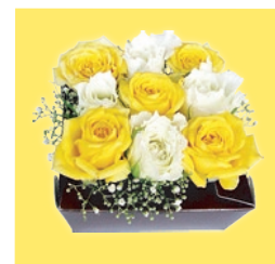
まっすぐ並べて挿してもおしゃれ