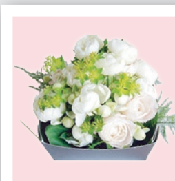
小さなお花を集めて丸わりやさしく