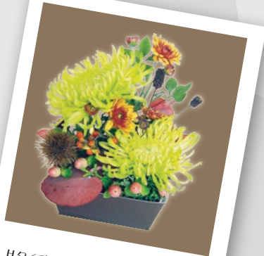
Hタイプなら生け花のように高さを反して