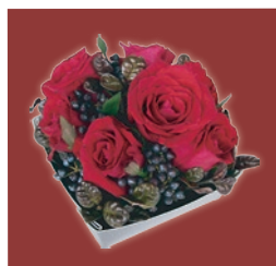
シックなカラーで大人の雰囲気