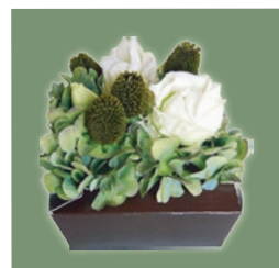
フラップを活かし起すナチュラルアレンジ