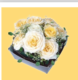
ワイヤープランツをぐるりと巻いて